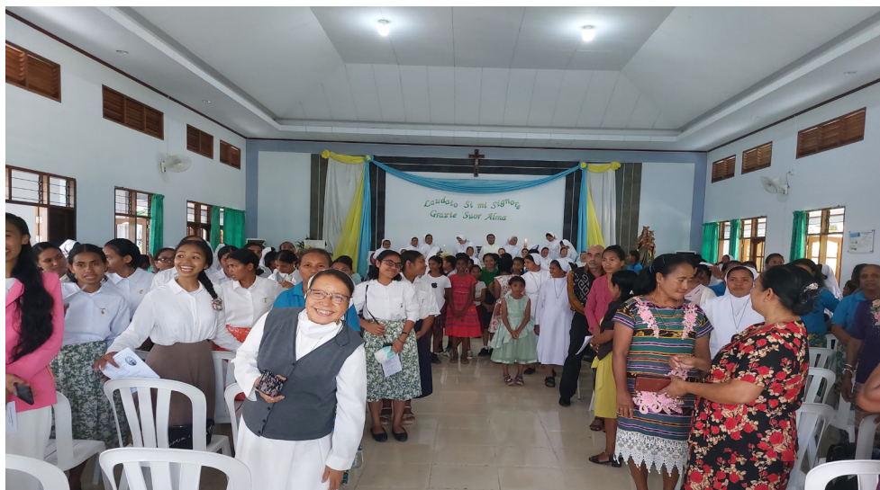
Tatoli - Lidun moris konsagrada

Tanba ne'e presiza deskobre valór antropolójiku kastidade nian no nune'e ninia valór espirituál kristaun.