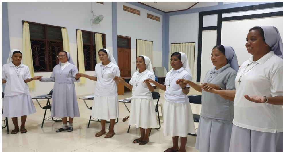
Tatoli - Lidun moris konsagrada

Ita biin-alin. Bazeia ba hola-parte ba familia umana ida de'it no ba hola-parte ba Kristu nia Isin, ita mak biin-alin. Bazeia ba ligasaun vokasionál-karizmatika, ne'ebé halo ita membru husi Institutu partikulár ida nian, ita iha ligasaun íntima ho membru sira ita-nia Kongregasaun nian no familia karizmatika ho ligasaun espirituál spesífika, orijinál ho fundamentu iha Karizma ne'e rasik..