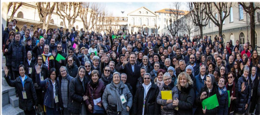
Tatoli -Fila fali ba abut