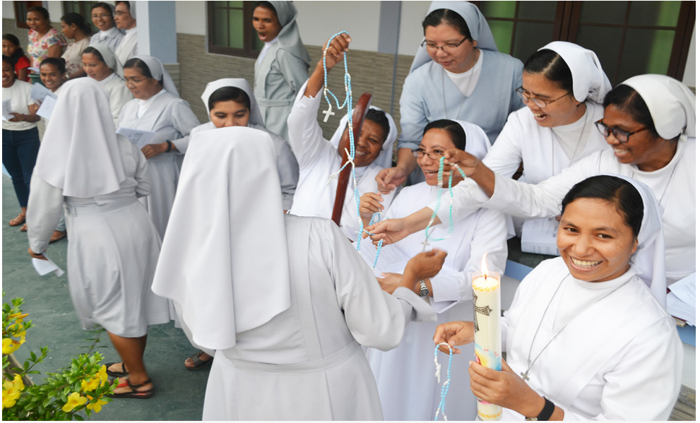
Tatoli - Lidun moris konsagrada

Iha Vida relijioza iha ka la iha karidade moris nian? Se iha karidade, ida-ne'e oin-sá? Karidad emoris nian iha vida konsagrada implika uluknanai "fiar". Hafoin karidade moris nian ita komesa husi komunidade, hafoin mak ih amisaun, nu'udar oportunidade di'ak liu, fatin atu hala;o karidade.