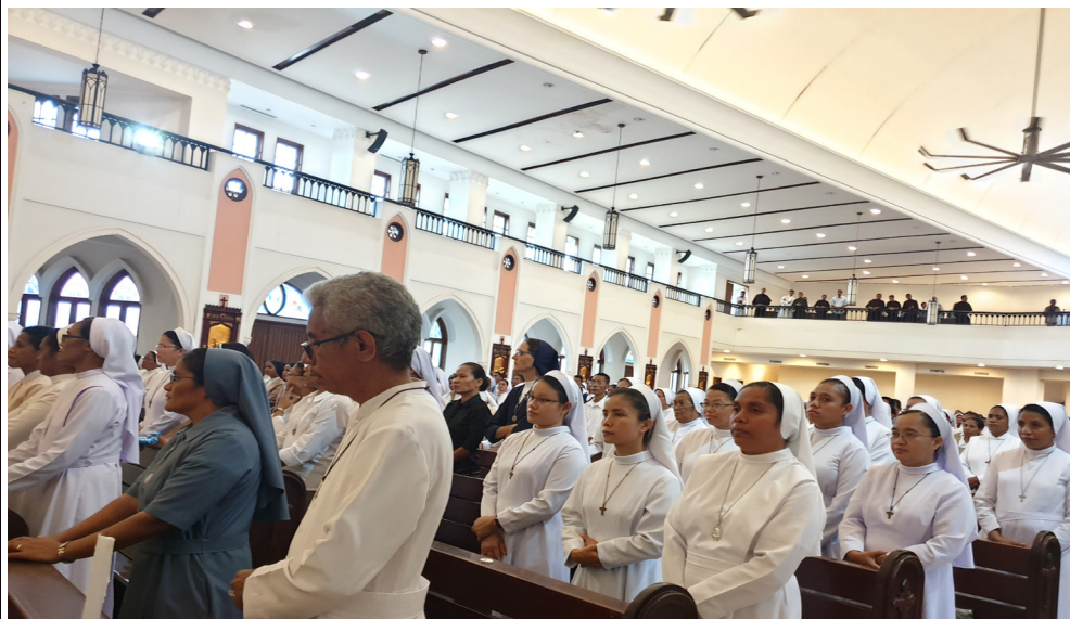
Tatoli - Lidun moris konsagrada

Iha sosiedade ida ne'e, iha pergunta barak ba joven sira hodi moris relijiozu. Oinsá ko'alia kona-ba pobreza iha sosiedade ne'ebé ema gosta konsumizmu, no iha sasán barak? Oinsá ko'alia kona-ba kastidade iha sosiedade ne'ebé buka ksolok husi seksu? Oinsá ko'alia kona-ba obediénsia iha sosiedade ne'ebé ema buka liberdade, autonomia? Oinsá ko'alia kona-ba vida fraterna ba sosiedade ne'ebé gosta individualizmu no moris tuir nia hakarak?.